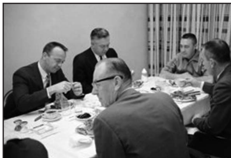
Я ничего не придумываю, в архиве НАСА это фото S65-21093 от 23 March 1965 так и подписано – Astronaut Virgil I. Grissom (facing camera at right), command pilot of the Gemini-Titan 3 flight, is shown during a steak breakfast which he was served about two hours prior to the 9:24 a.m. (EST) GT-3 launch on March 23, 1965.

Но это ещё не самое странное. Альпинисты поднимаются поэтапно, останавливаясь в базовых лагерях для адаптации к низкому давлению. Путешествие на «Крышу мира» и (если повезёт) назад длится около двух месяцев. Хотя сам рывок к пику занимает всего пару дней. Большинство времени – около сорока суток – тури-