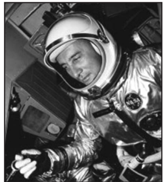
Это фото S65-23489 от 23 March 1965 в архиве НАСА так и подписано – Astronaut Virgil Grissom in Gemini-3 spacecraft prior to launch. To есть перед запуском.

Затем они приезжают к ракете и бодро машут ладошками провожающим – с открытыми шлемами. Более того, даже сев в кабину «Джемини», они забрали шлемов не закрывают, дышат обычным атмосферным воздухом: