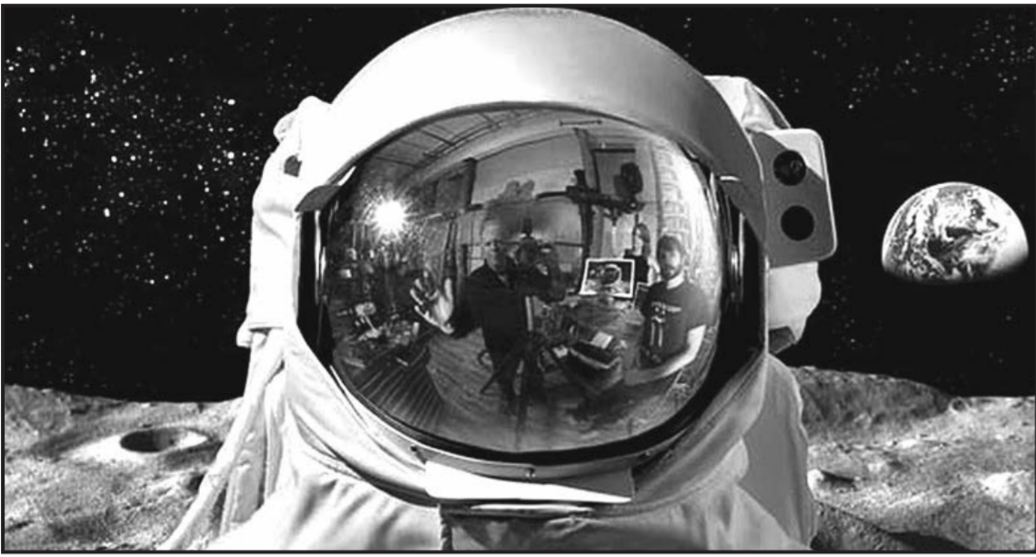
Поддельные астронавты НАСА.

Во всех американских космических кораблях – «Меркурия», «Джемини» и «Аполло» – по легенде космонавты дышали чистым кислородом при давлении около 0,3 атмосферы, чтобы их «космические» консервные банки полетче сделать (при нормальном давлении в кабине